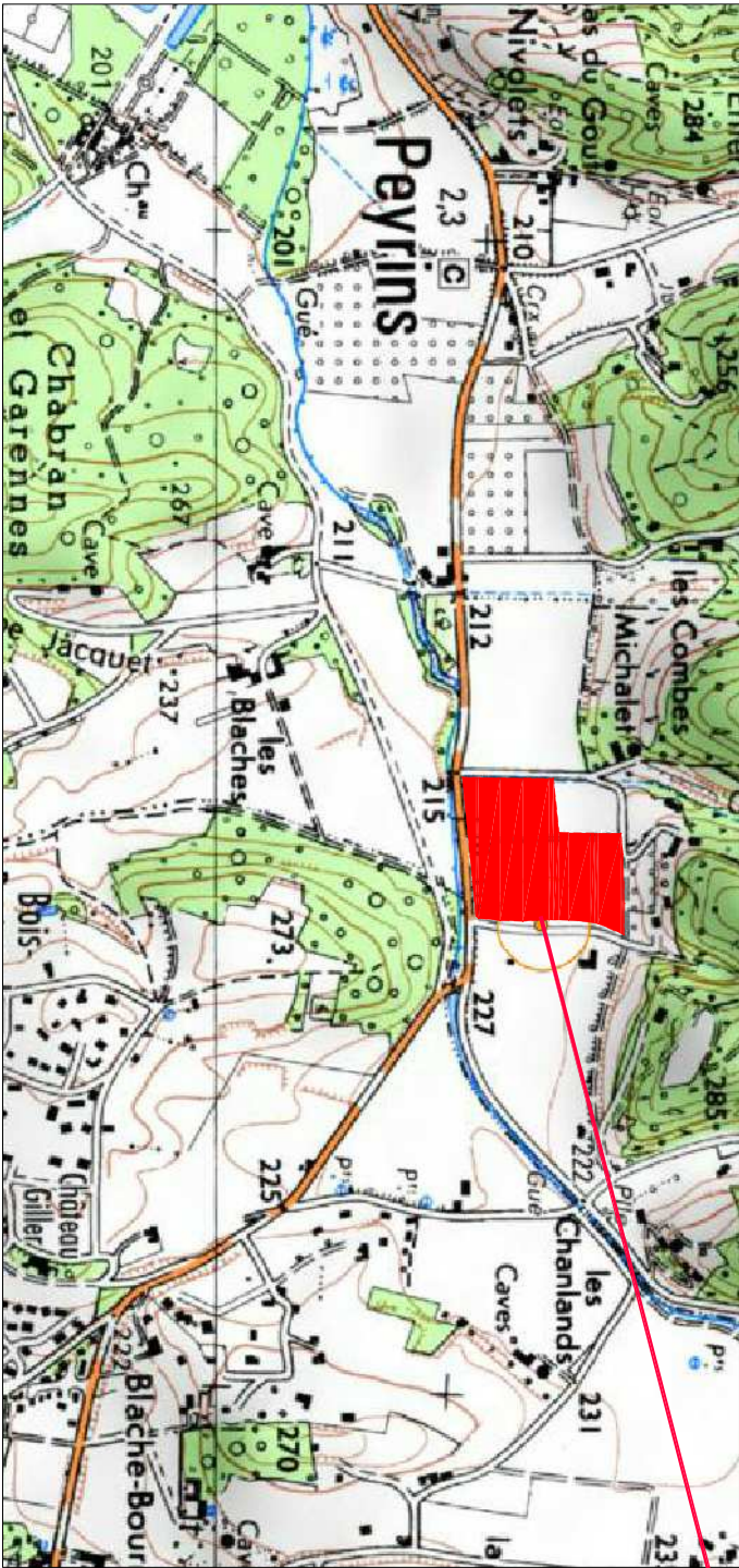
Ech. : sans

Terrain de 59 083m² Parcelles n° 21 & 23 section ZI